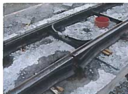
VBZ-Normgleiseinbau: Schienenprofil Ri 60N mit Phoenix- Streuromisolation. Elastische, kontinuierliche Schienenlagerung (maximale Einsenkung 1 mm)